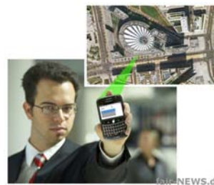
Der Cavea Locator bietet der Disposition mehr als den metergenaue Überblick über die Außendienste.