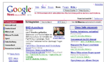
PresseAnzeiger.de Meldungen sind bei Google News Deutschland gelistet.