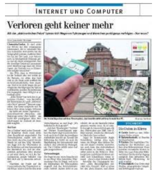
Der iDobber von der Firma Bornemann AG ist Made in Germany und erhielt im Testergebnis von der Freien Presse das Prädikat „ausgezeichnet“. [Großes Bild anzeigen]

„Freie Presse“ hat sich den so genannten iDobber – vom Hersteller, der Bornemann AG auch „elektronische Petze“ genannt – genauer angesehen. Das Gerät verspricht viel: Es könne über einen langen Zeitraum – das heißt mit einem Superakku – deutschlandweit Menschen oder Fahrzeuge orten. Über Satellit – das heißt fast punktgenau. Eine Freischaltungen im Ausland sei ebenfalls möglich.